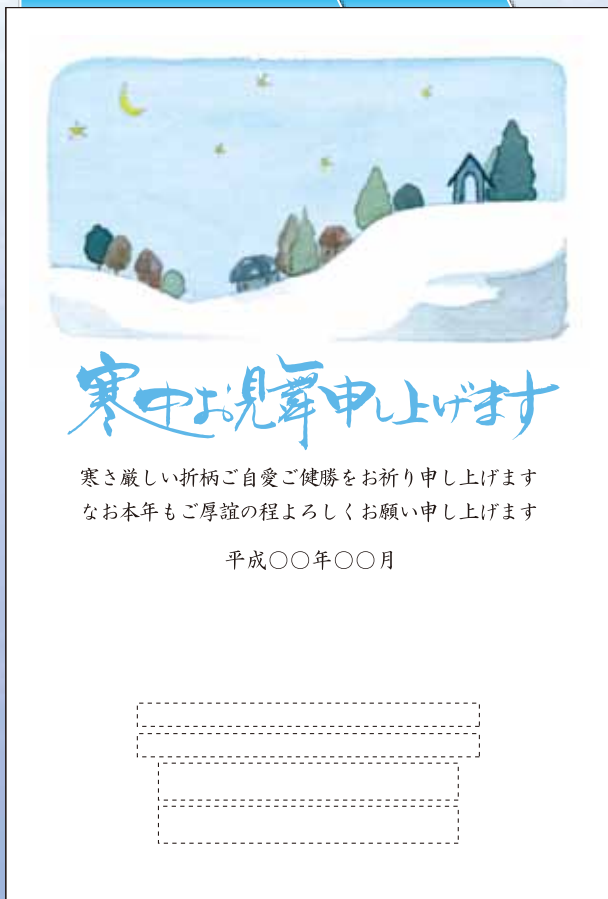
KC-14 イメージ[雪景色] 文例[K-903]