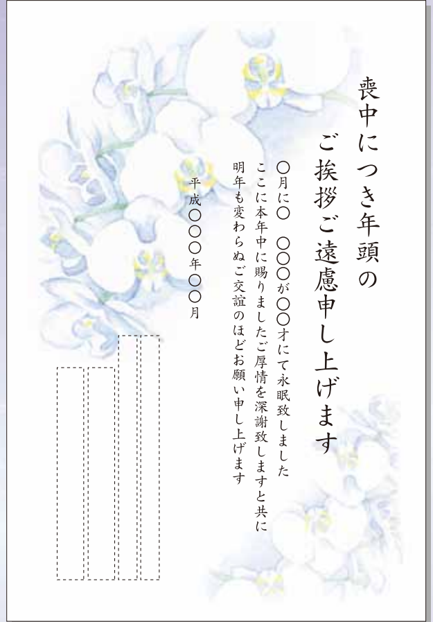
MN-006 イメージ[胡蝶蘭] 文例[M-808]