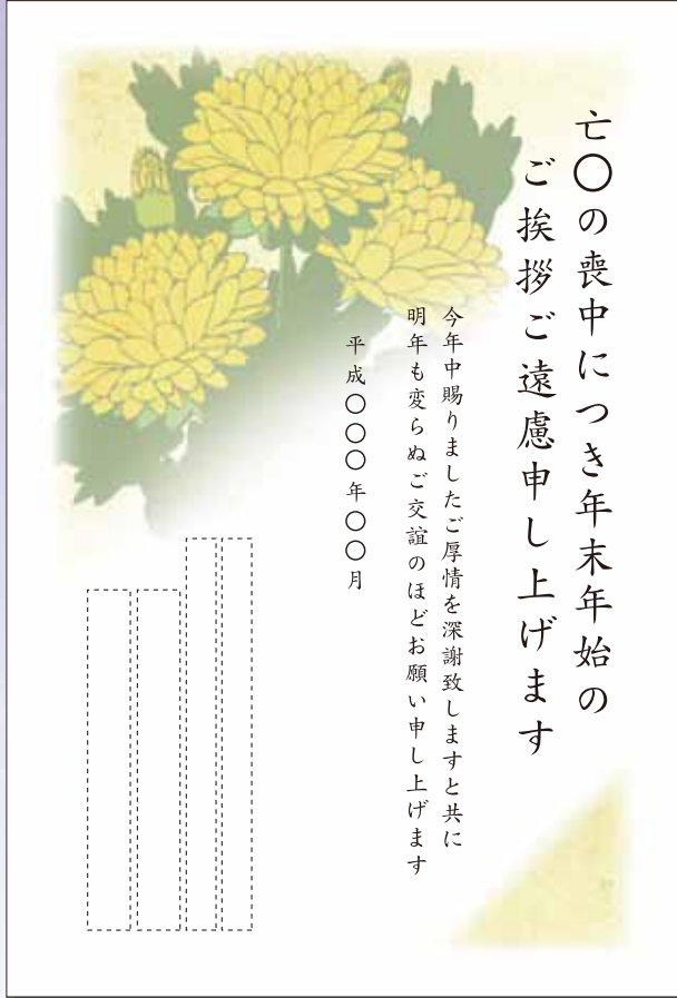
MN-005 イメージ[菊] 文例[M-804]